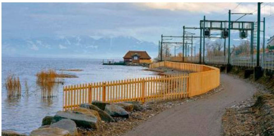
Pour le moment, se balader au bord du lac de Zurich n'est pas possible partout.

sible la réalisation du projet, alors que la volonté du législateur impose un accès aux rives du lac qui soit «réalisable, judicieux et acceptable». Il précise qu'envisager cette voie n'exclut pas une «pesée d'intérêts dans un cas particulier» et que l'expropriation pure et simple reste un instrument de dernier recours. -ATS