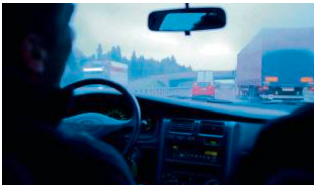
La police n'est pas la seule à pouvoir dénoncer un contrevenant.